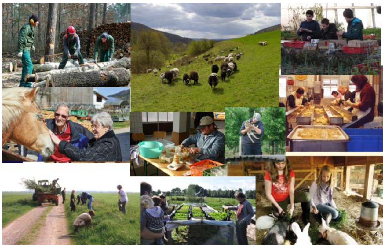
Sociálne poľnohospodárstvo v Nemecku