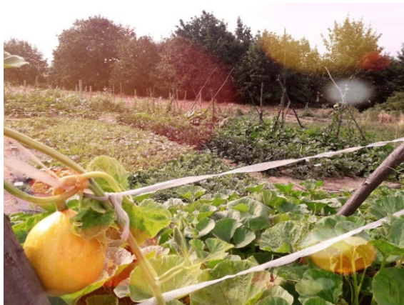
Sociálne poľnohospodárstvo v Českej republike.

prínos, napriek tomu toto nastavenie spôsobuje neochotu jednotlivých ministerstiev prevziať sociálne poľnohospodárstvo ako celok do svojho programu. V súčasnosti má sociálne poľnohospodárstvo najbližšie k sociálnemu podnikaniu, a preto prirodzene spadá pod Ministerstvo práce a sociálnych vecí. - Asociácie sociálneho poľnohospodárstva, zastrešujúca organizácia sociálneho poľnohospodárstva v Českej republike, opisuje sociálne poľnohospodárstvo nasledovne: "Poslaním sociálneho poľnohospodárstva nie je len výroba a predaj poľnohospodárskych produktov, ale aj: možnosť ponuky nových pracovných miest na farmách, poskytovanie sociálnych služieb, vzdelávacích aktivít a vykonávanie rôznych druhov terapií pre široké spektrum ľudí, najmä so zdravotným a sociálnym znevýhodnením." 2