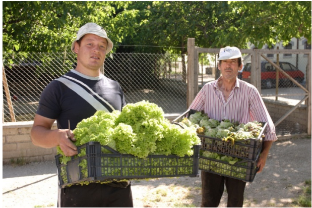
Sociálne poľnohospodárstvo v Taliansku.