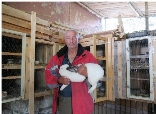
Sociálne poľnohospodárstvo na Slovensku.

Na Slovensku majú znevýhodnení ľudia vďaka sociálnemu poľnohospodárstvu možnosť udržať si alebo zlepšiť svoj zdravotný, sociálny a psychický stav, začleniť sa do spoločnosti alebo získať zamestnanie. Poľnohospodárska činnosť a prostredie farmy sa využíva na terapiu, rehabilitáciu, sociálnu integráciu, vzdelávanie, integrované zamestnávanie a sociálne služby. Umožňuje poľnohospodárom diverzifikovať svoje príjmy získaním iných zdrojov financovania.