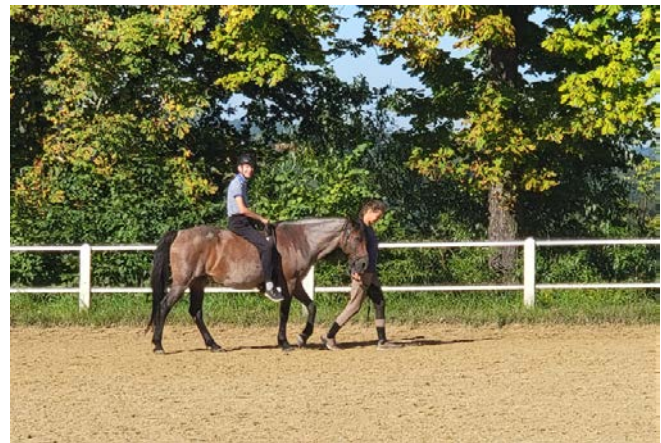
Sociálne poľnohospodárstvo v Poľsku.

V Taliansku sa od roku 2000 sociálne farmy čoraz viac rozrastajú. Talianske poľnohospodárske podmienky by mohli byť optimálne pre rozvoj sociálnych fariem. Kontakt s prírodou a zvieratami, životný štýl, ktorý rešpektuje životné prostredie, klímu a plody zeme - práca na pôde by mohla "liečiť" choroby, postihnutie alebo duševné, fyzické, sociálne a ekonomické ťažkosti. Sociálna farma má svoju úlohu: starať sa o jednotlivcov, poskytovať im zamestnanie a umožniť im cítiť sa užitočnou súčasťou komunity. Na mnohých sociálnych farmách sa často vykonávajú terapeutické činnosti na zlepšenie zdravia ľudí so zdravotným postihnutím, autizmom, ale aj ľudí s ekonomickými alebo sociálnymi ťažkosťami. Čoraz viac ľudí by sa chcelo zapojiť a chcelo by investovať do sociálneho poľnohospodárstva. Napriek tomu však v systéme existujú určité ťažkosti a kritické miesta, ktoré sociálne farmy v súčasnosti brzdia. Závislosť na verejnom financovaní a neistota systému bránia rastu tohto sektora. Rozvoj sociálnych fariem v Taliansku obmedzuje aj slabá spolupráca medzi sociálnymi farmami na tom istom území a nedostatočná komunikácia.