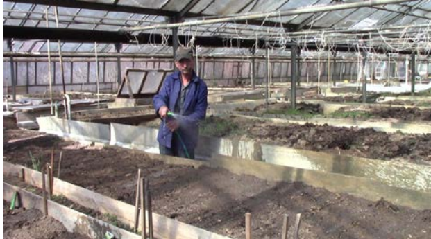
Sociálne poľnohospodárstvo na Slovensku.

Podpora zamestnávania občanov so zdravotným postihnutím: a) Zákon č. 311/2001 Z. z. Zákonník práce, b) Zákon č. 5/2004 Z. z. o službách zamestnanosti. Úrad práce, sociálnych vecí a rodiny vedie osobitnú evidenciu uchádzačov o zamestnanie, ktorí sú občanmi so zdravotným postihnutím a záujemcov o zamestnanie, ktorí sú občanmi so zdravotným postihnutím. Osobitná evidencia obsahuje aj údaje o poklese schopnosti vykonávať zárobkovú činnosť, ako aj údaje o právnom dôvode, na základe ktorého boli uznaní za občana so zdravotným postihnutím. K zákonným povinnostiam zamestnávateľa v uvedenej oblasti patrí najmä povinnosť zabezpečovať pre občanov so zdravotným postihnutím, ktorých zamestnáva, vhodné podmienky na výkon práce, povinnosť vykonávať zaškoľovanie a prípravu na prácu občanov so zdravotným postihnutím a venovať osobitnú starostlivosť zvyšovaniu kvalifikácie počas ich zamestnávania a povinnosť viesť evidenciu občanov so zdravotným postihnutím. Ďalšími príspevkami pre zamestnávateľa, ktorý zamestnáva občanov so zdravotným postihnutím sú príspevok na udržanie občana so zdravotným postihnutím v zamestnaní, príspevok na úhradu prevádzkových nákladov chránenej dielne alebo chráneného pracoviska a na úhradu nákladov na dopravu zamestnancov, príspevok na podporu zamestnávania znevýhodneného uchádzača o zamestnanie a príspevok občanovi so zdravotným postihnutím na samostatnú zárobkovú činnosť.