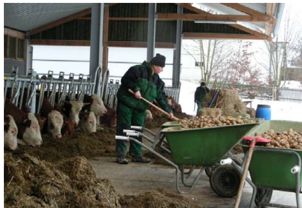
Sociálne poľnohospodárstvo v Nemecku.

Pracovné miesto v chránenej dielni pre osoby so zdravotným postihnutím je pre tieto osoby zaručené zákonom. V minulosti mnohé dielne prevádzkovali vlastné farmy, aby sa mohli zásobovať potravinami, pretože to bolo čoraz menej výhodné. Na druhej strane, dnes je motívom prevádzkovania farmy poskytovanie atraktívnych pracovných miest, pretože rôznorodosť práce na farme umožňuje širokú škálu zmysluplných činností. Môže to zísť až tak ďaleko, že spoločenské organizácie budú zakladať nové farmy, ak sa v poľnohospodárstve nenájdu partneri na spoluprácu.