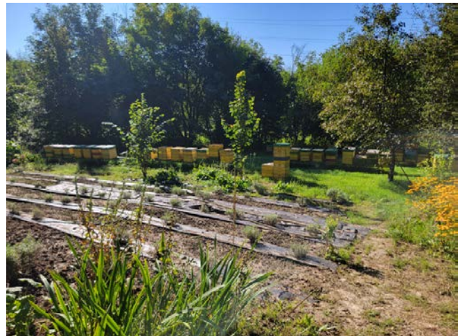
Sociálne poľnohospodárstvo v Poľsku.

Toto všetko si vyžaduje, aby sociálna farma fungovala na základe existujúcich organizačných foriem jednotiek sociálnej starostlivosti. To umožní istým spôsobom automaticky splniť všetky požiadavky na tento typ zariadení. Z hľadiska osoby, ktorá zriaďuje opatrovateľský domov, ide teda o výrazné zjednodušenie - je výhodnejšie použiť hotové modely ako od základu vytvárať inštitúciu, ktorej fungovanie bude na každom kroku konfrontované s právnymi prekážkami. Využitie v súčasnosti dostupných foriem poskytovania starostlivosti v rámci mimovládnych organizácií alebo spoločností má ďalšiu dôležitú výhodu. Tento koncept umožňuje využiť dostupné zdroje financovania tohto typu zariadenia. Máme tak k dispozícii finančné prostriedky smerujúce do vidieckych oblastí v súvislosti s rozvojom podnikania. V prípade sociálnych družstiev je možné využiť prostriedky určené na rozvoj sociálnej ekonomiky. Takisto je možné využiť vládne a regionálne programy dotujúce zriadenie a prevádzku zariadení opatrovateľskej služby. Vďaka finančným prostriedkom, ktoré dostávajú na starostlivosť vo svojom hospodárstve, môžu opatrovatelia modernizovať svoje hospodárstvo, modernizovať svoje poľnohospodárske činnosti alebo začať či rozvíjať iné nepoľnohospodárske činnosti.