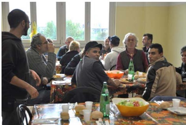
Sociálne poľnohospodárstvo v Taliansku – Cooperativa Sociale Aretè.