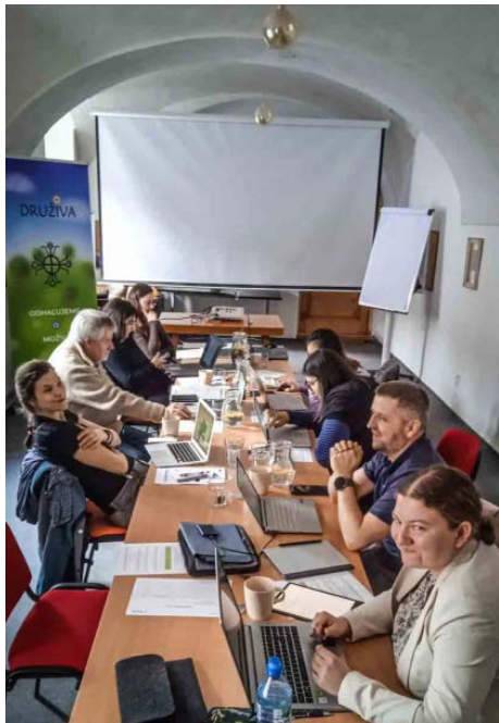
Stretnutia projektového tímu v Prahe (CZ, 15.11.2022), v Rožňave (SK, 28.3.2023) a v Krakowe (5.9.2023)

PETRARCA e.V. zhromaždili národné správy z Česka, Slovenska, Poľska, Talianska a Nemecka a vypracovali medzinárodnú správu ako dodatočný extrakt.