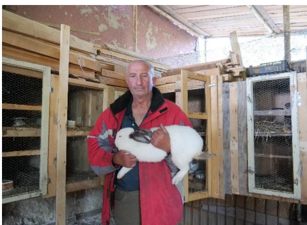
Rolnictwo społeczne na Słowacji.

Rolnictwo społeczne to w Polsce wciąż mało znany termin. Obejmuje szeroki zakres działań odpowiadających na potrzeby o charakterze opiekuńczym i społecznym. Terminy często używane zamiennie to: rolnictwo opiekuńcze, rolnictwo dla zdrowia, rolnictwo społeczne, zielona opieka, zielone ćwiczenia i terapia rolnicza. Potencjalnymi grupami docelowymi dla tego typu gospodarstw są: osoby niepełnosprawne umysłowo, osoby o ograniczonej sprawności ruchowej, osoby opuszczające zakłady