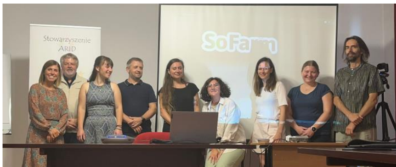
Spotkania zespołu projektowego w Pradze (15.11.2022), Rożniawie (28.3.2023) i Krakowie (5.9.2023)