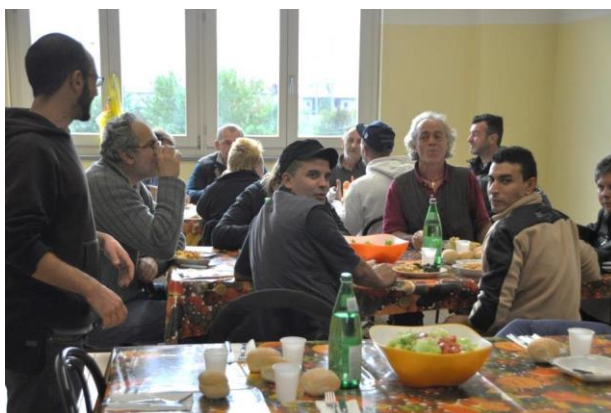
Rolnictwo społeczne we Włoszech - Cooperativa Sociale Aretè.