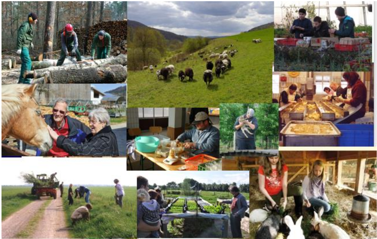
Rolnictwo społeczne w Niemczech® PETRARCA e.V.