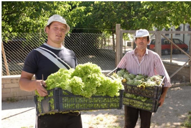
Rolnictwo społeczne we Włoszech® Massimo Vollaro

Rolnictwo społeczne w Niemczech jest rozumiane jako połączenie rolnictwa z pracą społeczną i/lub pedagogiczną. Istnieją zielone obszary warsztatów dla osób niepełnosprawnych (WfbM; rolnictwo, ogrodnictwo), często prowadzone przez kościół lub innych dostawców), antropozoficzne wspólnoty życia i pracy, pedagogiczne gospodarstwa szkolne i przedszkola, a także inne gospodarstwa specjalizujące się głównie w określonych grupach docelowych (zapobieganie uzależnieniom, długotrwanie bezrobotni, bezdomni, resocjalizacja więźniów, pomoc młodzieży, migranci / młodzież bez opieki, seniorzy, seniorzy cierpiący na demencję, a także rolnictwo wspierane przez społeczność (CSA) oraz miejskie / międzykulturowe ogrody społecznościowe.