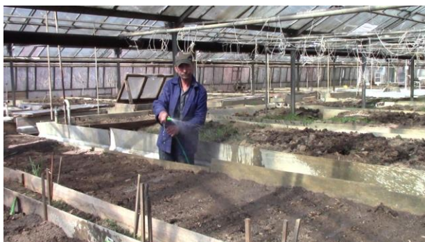
Rolnictwo społeczne na Słowacji.

Wsparcie zatrudnienia obywateli niepełnosprawnych: a) Ustawa nr 311/2001 Dz. Kodeks pracy, b) Ustawa nr 5/2004 Coll. o służbach zatrudnienia. Urząd Pracy, Spraw Socjalnych i Rodziny prowadzi specjalne rejestry osób ubiegających się o pracę, które są niepełnosprawnymi obywatelami oraz osób poszukujących pracy, które są niepełnosprawnymi obywatelami. Specjalne rejestry zawierają również dane dotyczące spadku zdolności do wykonywania pracy zarobkowej, a także dane dotyczące przyczyny prawnej, na podstawie której zostali uznani za obywateli niepełnosprawnych. Do obowiązków prawnych pracodawcy we wspomnianym zakresie należy w szczególności obowiązek zapewnienia zatrudnianym przez siebie obywatelom niepełnosprawnym odpowiednich warunków wykonywania pracy, obowiązek zapewnienia obywatelom niepełnosprawnym szkoleń i przygotowania zawodowego do pracy oraz zwracania szczególnej uwagi na podnoszenie ich kwalifikacji w trakcie zatrudnienia, a także obowiązek prowadzenia ewidencji obywateli niepełnosprawnych. Inne składki dla pracodawcy zatrudniającego obywateli niepełnosprawnych to składka na utrzymanie zatrudnienia obywatela niepełnosprawnego, składka na pokrycie kosztów operacyjnych zakładu pracy chronionej lub zakładu pracy chronionej oraz na pokrycie kosztów transportu pracowników, składka na wsparcie zatrudnienia osoby poszukującej pracy