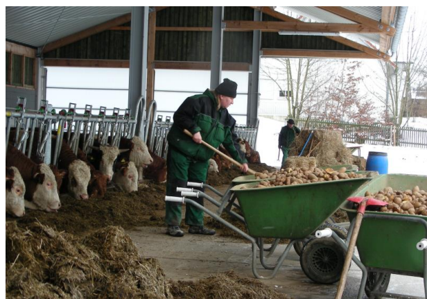
Rolnictwo społeczne w Niemczech.

Praca w warsztacie dla osób niepełnosprawnych jest gwarantowana przez prawo. W przeszłości wiele warsztatów prowadziło własne gospodarstwa rolne, aby zaopatrywać się w żywność, ponieważ stawało się to coraz mniej opłacalne. Z drugiej strony, obecnie motywem prowadzenia gospodarstwa jest zapewnienie atrakcyjnych miejsc pracy, ponieważ różnorodność pracy w gospodarstwie pozwala na szeroki wachlarz znaczących działań. Może to zająć tak daleko, że organizacje społeczne zakładają nowe gospodarstwa, jeśli nie można znaleźć partnerów do współpracy w rolnictwie.