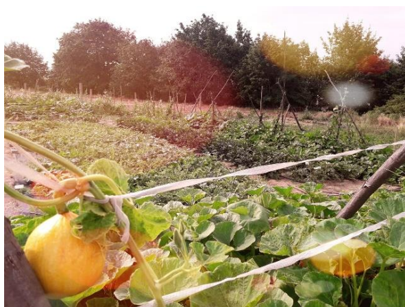
Rolnictwo społeczne w Czechach.

Na Słowacji dzięki rolnictwu społecznemu osoby znajdujące się w niekorzystnej sytuacji mają możliwość utrzymania lub poprawy swojego stanu zdrowia, kondycji społecznej i psychicznej, integracji ze społeczeństwem lub uzyskania zatrudnienia. Wykorzystuje ono działalność rolniczą i środowisko gospodarstwa do terapii, rehabilitacji, integracji społecznej, edukacji, zintegrowanego zatrudnienia i usług społecznych. Umożliwia rolnikom dywersyfikację dochodów poprzez uzyskanie innych źródeł finansowania. Chociaż koncepcja rolnictwa społecznego jest stosunkowo nowa, usługi, które obejmuje, są wdrażane w różnych formach w miejscach na całej Słowacji, nawet jeśli nie używają tego terminu i nie są nawet ze sobą powiązane. Nie ma jeszcze podstaw w konkretnej polityce lub ramach instytucjonalnych.