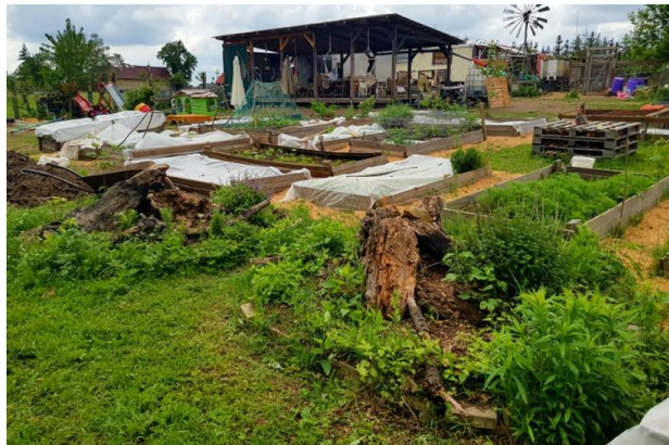
Sociální zemědělství v Česku.