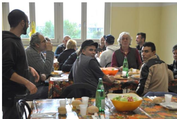
Sociální zemědělství v Itálii - Cooperativa Sociale Aretè.

Na státní úrovni se zákonem č. 141 ze dne 18. srpna 2015 s názvem "Ustanovení o sociálním zemědělství" uznávají a upevňují dosavadní zkušenosti se sociálním zemědělstvím, zavádějí se základní pojmy, vymezují se cíle, definuje se samotný pojem „sociální zemědělství“ a stanovuje se postup veřejné identifikace takových subjektů a určují se příjemce činností farmy. Zákon z roku 2015 tak podporuje sociální zemědělství "jako aspekt multifunkčnosti zemědělských podniků zaměřený na rozvoj sociálních, sociálně-zdravotních, vzdělávacích a sociálně-pracovních integračních služeb s cílem usnadnit přiměřený a jednotný přístup k základním službám, které mají být zaručeny osobám, rodinám a místním společenstvím na celém území státu, a zejména ve venkovských nebo znevýhodněných oblastech".