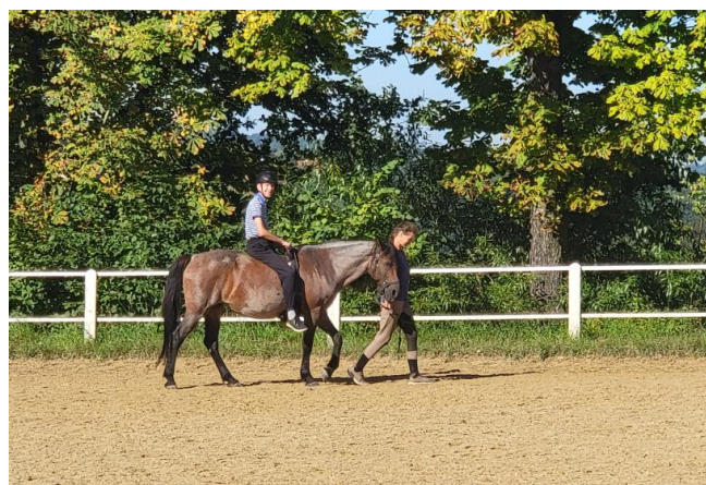
Sociální zemědělství v Polsku.

V Itálii se od roku 2000 stále více rozrůstají sociální farmy. Italské zemědělské prostředí by mohlo být pro rozvoj sociálních farem optimální. Kontakt s přírodou a zvířaty, životní styl respektující životní prostředí, klima a plody země, práce na půdě by mohla "léčit" nemoci, postižení nebo duševní, fyzické, sociální a ekonomické potíže. Sociální farma má svou úlohu: pečovat o jednotlivce, poskytovat jim zaměstnání a umožnit jim cítit se užitečnou součástí komunity. Na mnoha sociálních farmách často probíhají terapeutické činnosti, které mají zlepšit zdravotní stav lidí s postižením, autismem, ale také lidí s ekonomickými nebo sociálními potížemi. Stále více lidí by se rádo zapojilo a investovalo do sociálního zemědělství. Přesto však v systému existují určité potíže a kritické body, které v současné době sociální farmy brzdí. Závislost na veřejném financování a nejistota systému brání růstu odvětví. Rozvoj sociálních farem v Itálii omezuje také špatná spolupráce mezi sociálními farmami v rámci jednoho území a nedostatečná komunikace.