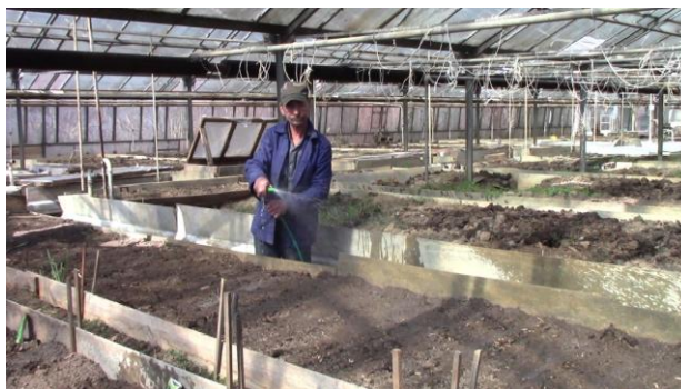
Sociální zemědělství na Slovensku.

Podpora zaměstnávání občanů se zdravotním postižením: a) Zákon č. 311/2001 Sb. Zákoník práce, b) zákon č. 5/2004 Sb. o službách zaměstnanosti. Úřad práce, sociálních věcí a rodiny vede zvláštní evidenci uchazečů o zaměstnání, kteří jsou občany se zdravotním postižením, a zájemců o zaměstnání, kteří jsou občany se zdravotním postižením. Zvláštní evidence obsahuje také údaje o poklesu schopnosti vykonávat výdělečnou činnost a údaje o právním důvodu, na základě kterého byli uznáni za občana se zdravotním postižením. Mezi zákonné povinnosti zaměstnavatele v uvedené oblasti patří zejména povinnost zajistit vhodné podmínky pro výkon práce občanům se zdravotním postižením, které zaměstnává, povinnost zajistit školení a přípravu k práci pro občany se zdravotním postižením a věnovat zvýšenou pozornost zvyšování jejich kvalifikace v průběhu zaměstnání a povinnost vést evidenci občanů se zdravotním postižením. Dalšími příspěvky pro zaměstnavatele, který zaměstnává občany se zdravotním postižením, jsou příspěvek na udržení občana se zdravotním postižením v zaměstnání, příspěvek na úhradu provozních nákladů chráněné dílny nebo chráněného pracovního místa a na úhradu nákladů na dopravu zaměstnanců, příspěvek na podporu zaměstnávání znevýhodněného uchazeče o zaměstnání a příspěvek občanovi se zdravotním postižením na samostatnou výdělečnou činnost.