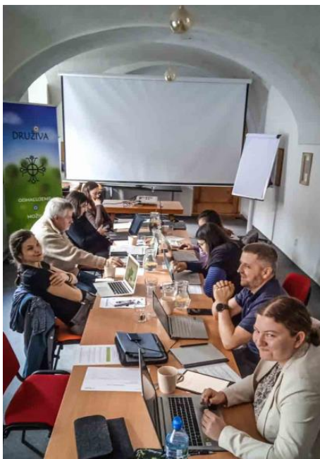
Setkání projektového týmu v Praze (15.11.2022), Rožňavě (28.3.2023) a Krakově (5.9.2023).

Společnost PETRARCA e.V. shromáždila národní zprávy z Česka, Slovenska, Polska, Itálie a Německa a na základě těchto informací zpracovala tuto souhrnnou mezinárodní zprávu.