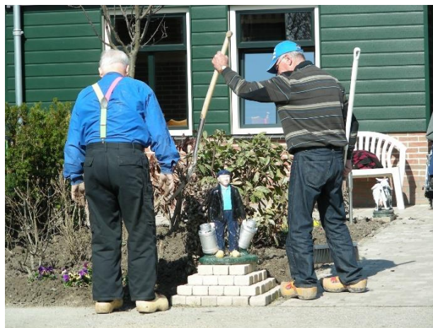
Mnoho farem v Nizozemsku nabízí denní péči o seniory trpící demencí