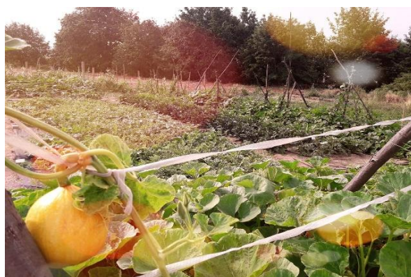
Sociální zemědělství v Česku.

Na Slovensku mají znevýhodněné osoby díky sociálnímu zemědělství možnost udržet si nebo zlepšit svůj zdravotní, sociální a psychický stav, začlenit se do společnosti nebo získat zaměstnání. Využívá zemědělské činnosti a prostředí farmy k terapii, rehabilitaci, sociální integraci, vzdělávání, integrovanému zaměstnávání a sociálním službám. Umožňuje zemědělcům diverzifikovat jejich příjmy získáním dalších zdrojů financování. Přestože je koncept sociálního zemědělství poměrně nový, služby, které zahrnuje, jsou v různých formách realizovány na místech po celém Slovensku. Zatím nemá oporu v konkrétním politickém nebo institucionálním rámci.